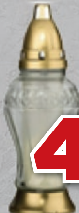
ZNICZ L-505 SZKLANY KOLOR WÓJCIK