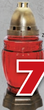
ZNICZ Z-384 KOLUMNA ANTYCZNA WÓJCIK