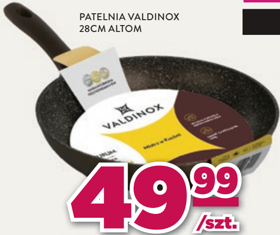
PATELNIĄ VALDINOX 28CM ALTOM