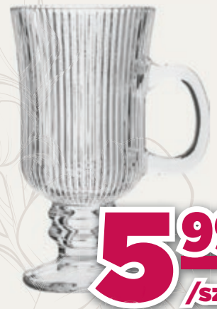
KUBEK NA STOPCE SELENA 245ML ALTOM