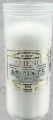
WKŁAD PARAFINOWY PRASOWANY 180X56 WÓJCIK