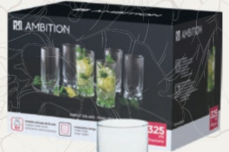
KOMPLET SZKLANEK 6SZT. DIAMOND AMBITION