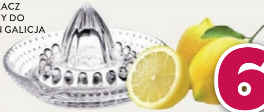
WYCISKACZ SZKLANY DO CYTRYNY GALICJA