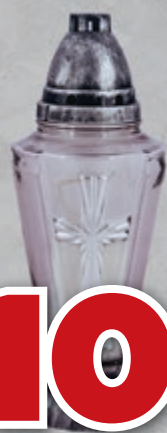
ZNICZ Z-396 KRZYŻ WÓJCIK