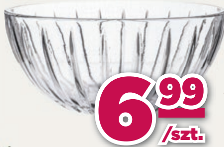
SALATERKA SZKLANA VENUS 17,5CM ALTOM