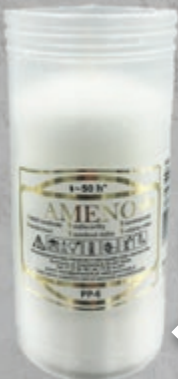
WKŁAD PARAFINOWY PRASOWANY 140X56 WÓJCIK